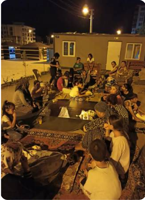
Adıyaman, 2023, Kaldırılmak üzere olan çadır yerleşkesinin son gecesinde, konteynerlere geçtikten sonra neyle karşılaşacaklarını bilmeyen kadın ve çocuklarla masal anlatısı ve sohbet