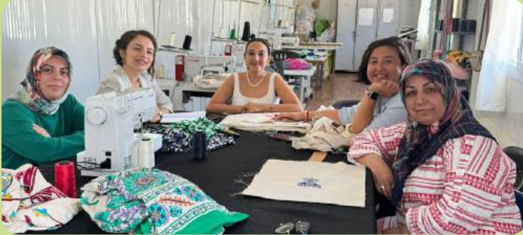
Açılan ve gelişen dikiş kursu, Adıyaman, 2024

Bugün Aysel yalnızca bir eğitmen değil; kadınları bir araya getiren, topluluk kuran ve değişimi başlatan bir öncü. Bu hikâye bize şunu gösteriyor: Doğru koşullar ve güvenli bir alan sağlandığında, kadınlar yalnızca hayata tutunmaz; hayatı dönüştürür.