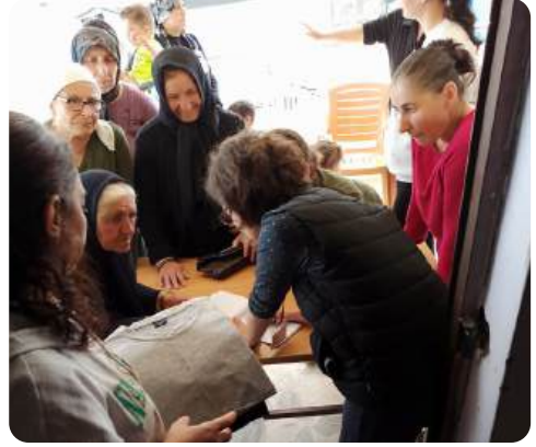
Depremden etkilenen kadınlarla birlikte dağıtım organize edilmesi.