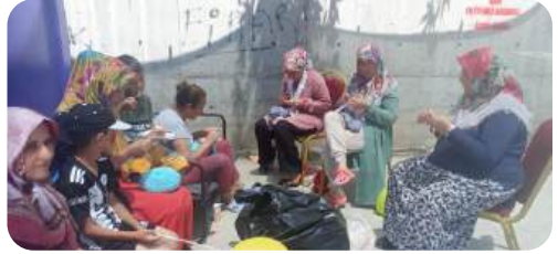
Adıyaman, 2023 - Çadırkentte gölgelik alanda örgü kursunun ilk günü