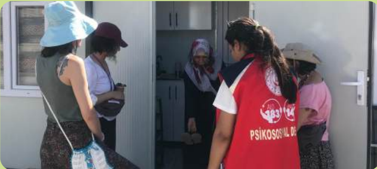
Dikiş hocasını ilk ziyaret, Adıyaman, 2023