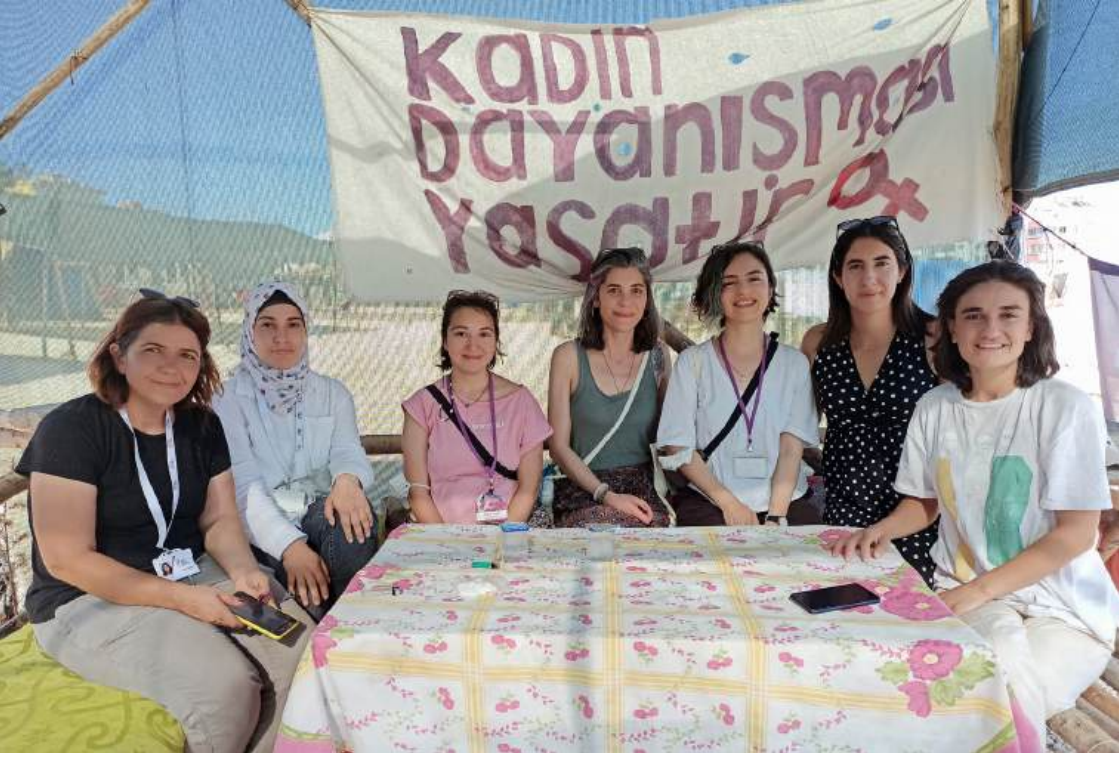
Temmuz, 2023 Feminist Afet Cadırı, Adıyaman - ÇemberDE, Lider Kadın Derneđi ve Dayanışmanın Kadın Hali Derneđi ile birlikte